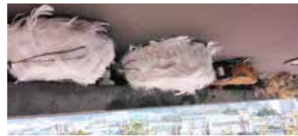
ヒメアマツバメの人工巣