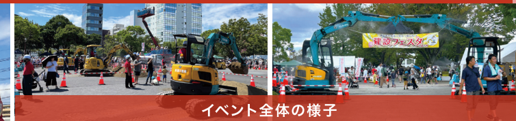
イベント全体の様子

8月27日(日)、一般社団法人厚木市建設業協会主催の「建設フェスタ」が厚木中央公園で4年ぶりに開催され、小島組もブース参加しました。次世代を担う子どもたちに向けて、建設産業の役割と魅力を知ってもらおうと企画されたこのイベントは、各ブースにて様々な種類の重機の展示や撮影、ゲーム、作業体験、試乗など普段ではできない貴重な体験ができます。当日は子どもだけでなく大人も一緒に楽しむ様子が多うかがえ、会場は大いに盛り上がりました。このようなイベントを通じ、建設業の魅力が少しでも子供たちに伝わってくれば嬉しいです。