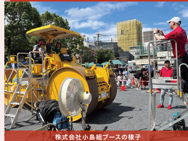
株式会社小島組ブースの様子