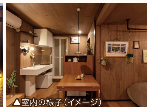
▲室内の様子(イメージ)