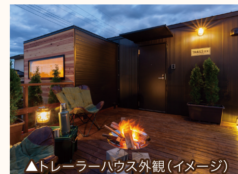
▲トレーラーハウス外観(イメージ)