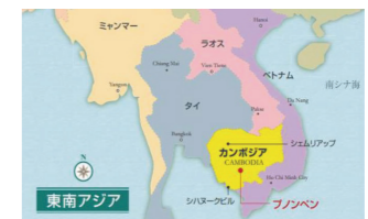
首都プノンペンの街の様子

カンボジアの正式名称は、「カンボジア王国」といい、東南アジアに位置。国土は日本の約半分(181,035km 2 )、人口は1,650万人、公用語はクメール語ですが英語を話せる人が多いです。カンボジアの国旗の中央にデザインされているのが、世界遺産にもなっている「アンコールワット」です。12世紀に約30年かけて作られ、クメール建築の最高傑作とも称される三大仏教寺院のひとつ。これは一生に一度は見てほしい神秘的な遺跡です!!カンボジアの首都は、「プノンペン」。街の中心にカンボジア王宮があり、トレサップ川とメコン川河畔にあります。フランス植民地時代の影響が街に残り、「東洋のパリ」と称されるほどの美しさがあります。コジマグミカンボジアオフィスから撮影した街の様子です。次号では、カンボジアの「食」についてご紹介したいと思います。お楽しみに!