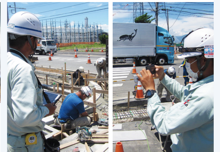
【タブレットやスマホを利用した現場の様子】

小島組では、建設現場の働き方改革の一環としてITサービスの活用を進め、この度「ANDPAD(アンドパッド)」を導入しました。「ANDPAD」は、スマホやタブレットを通じて、工程表、図面、写真などの工事情報と資料をクラウド上で一括管理し、現場の関係者がいつでもどこでも閲覧・共有できるサービスです。