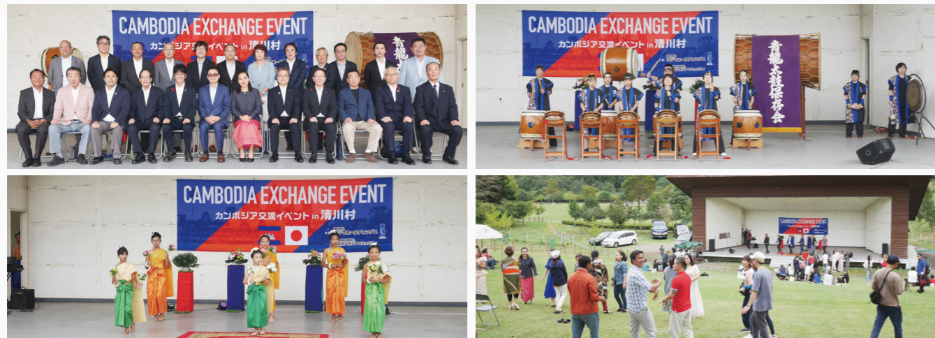
【主催】特定非営利活動法人 在日カンボジアコミュニティ / (株)コジマホールディングス 【協力】 小島組カンボジア 【後援】 清川村 / 愛川町 / 厚木市 【お問い合わせ先】 小島組・海外事業部 TEL 046-221-4545